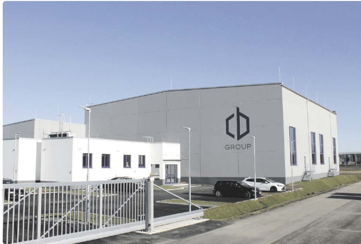
Neuer Betriebsstandort der CB Chemie in Siegendorf, Österreich